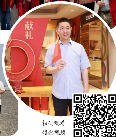
扫码观看 超燃视频