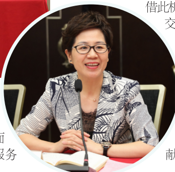
导和支持下，以全力打造“一座桥、一所校、一个家、一面旗”的“四个一”服务