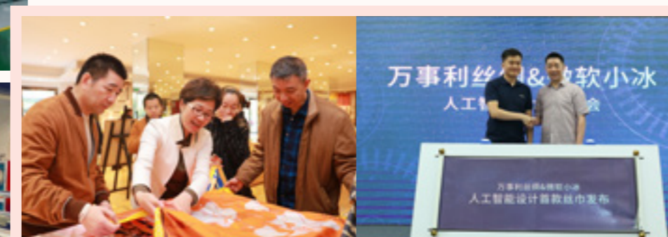
阿里云创始人王坚赋能丝绸数字化

积极拥抱数字经济，万事利丝绸走在探索实践“新制造”升级的最前列。万事利丝绸建成国内规模最大的数码印花智能工厂，并积极依托人工智能、大数据等前沿高新技术提升品牌产品的市场竞争力，自主研发成功的色彩管理系统、双面数码印花等核心技术领先全球。与此同时，依托基于人工智能、大数据的“西湖一号”和“万事礼”两大丝巾设计定制平台，万事利开启“丝绸智造”新时代。