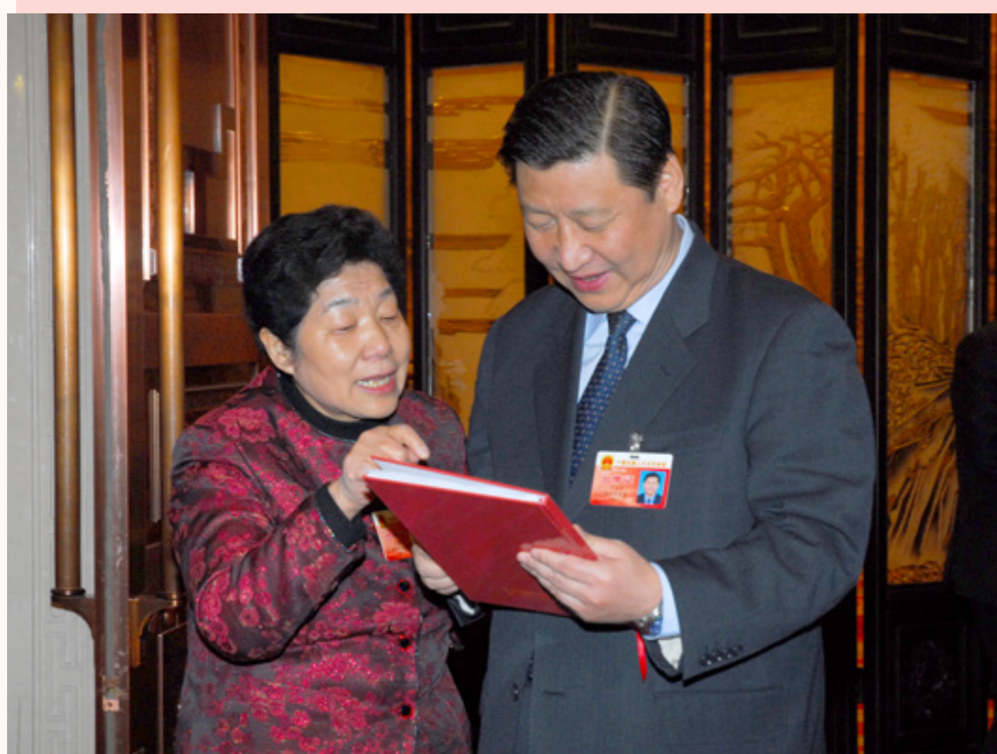
2007年3月，习近平同志在十届全国人大五次会议期间专门听取了全国人大代表沈爱琴提交的“关于设计生产奥运纪念品的报告”，高兴地说：“你们的设计非常好，很有创意，很有代表性，政府应该予以重视。需要政府协助解决的事情，要提出来，各级部门一定会大力支持。”

“丝绸是中国的宝贝，你们一定要传承好，弘扬好。”时刻牢记领导的殷殷嘱托，万事利两代人以振兴中国丝绸为己任，45年心无旁骛，一心一意专注做精做透丝绸产业，以丰富的转型升级实践打开了全新天地，迎来自身跨越式发展的同时为其他传统产业提供了有力的借鉴，集团的发展成果备受肯定。集团也把来自各界的关怀和殷切希望转化为强劲的发展动能，脚踏实地，不断探索文化、技术、品牌、模式的创新创造，为早日实现“让世界爱上中国丝绸”而不懈奋斗。