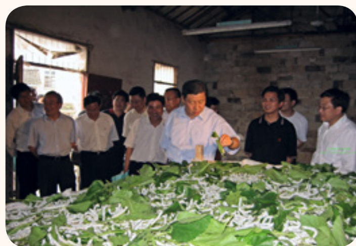
在浙江工作期间，习近平同志十分关心桑蚕业的发展，曾多次调研桑蚕生产工作。