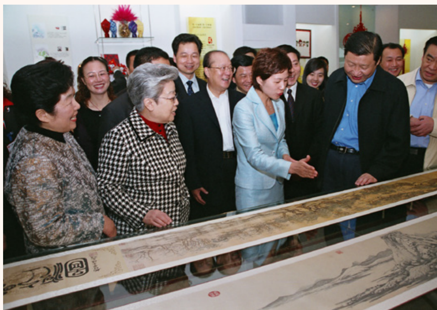
2003年4月，习近平同志考察万事利集团。期间，在屠红燕的介绍下，习近平饶有兴趣地欣赏了由万事利创新技术生产的丝绸卷轴画《清明上河图》。