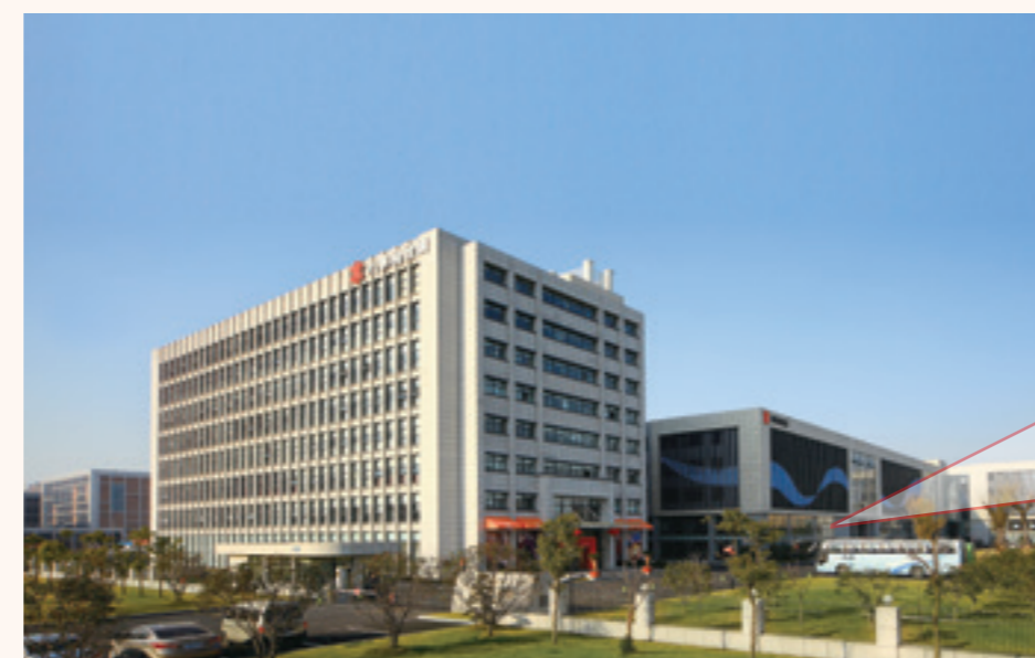
万事利丝绸文化创意产业园