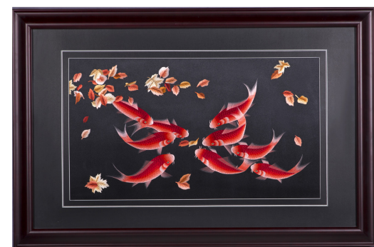
名称：年年有余 规格：100×64cm 装裱：镜框 类别：苏绣

释义：鲤鱼代表了吉祥如意，自古以来就有鲤鱼跃龙门之说，象征着步步高升。红鲤鱼也代表财富，寓意财源广阔、财源广进。画面中，九条红鲤鱼代表九五之尊、一言九鼎，是“神圣”“吉祥”之意，“九”与“久”谐音，表达万寿无疆和永久富裕之意。